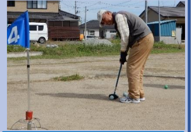
全国大会5位の実力者！ これが入れば……

清々しい風が通り抜け、スポーツの秋に相応しい晴天に恵まれた9月26日(木)、まち協恒例の『秋のスポーツ交流会・グランドゴルフ大会』が港町区特設のグランドゴルフ場で行われました。50名近い参加者は8グループに分かれてプレーを開始し、3ラウンドマッチで行われました。参加者の中にはご高齢ながら小走りでボールを追う姿に年齢(実際は93歳)を感じさせない若々しさが弾けていました。試合終了後は、手作りの『トン汁』でパワーを補給し、プレーの自慢話を熱く語って交流を深める姿に、世話役と調理担当にも笑顔が溢れました。