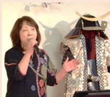
自慢の歌を熱唱する出場者