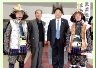
武者姿が凛々しいです

11月2日（土）の巨理町文化祭の折、甲冑製作プロジェクトから武者装束に甲冑を纏い、和太鼓に合わせてステージを盛り上げる役を果たしました。