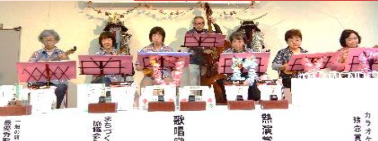
カラオケ 熱演 歌唱 万風窯陶芸教室