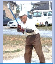
いけいけ～！ 真っすぐいけ～！