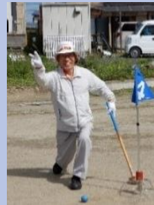
ナ～イス ショット！ はいポーズ。

清々しい風が通り抜け、スポーツの秋に相応しい晴天に恵まれた9月26日(木)、まち協恒例の『秋のスポーツ交流会・グランドゴルフ大会』が港町区特設のグランドゴルフ場で行われました。50名近い参加者は8グループに分かれてプレーを開始し、3ラウンドマッチで行われました。参加者の中にはご高齢ながら小走りでボールを追う姿に年齢(実際は93歳)を感じさせない若々しさが弾けていました。試合終了後は、手作りの『トン汁』でパワーを補給し、プレーの自慢話を熱く語って交流を深める姿に、世話役と調理担当にも笑顔が溢れました。