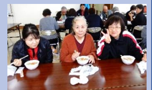
トン汁も楽しみだね