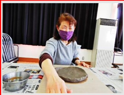
もう少し、もう少しで完成ですよ！