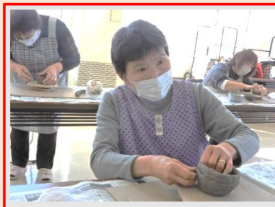
この辺がちよこっと難しいだね

2月25日(木)、蔵王町万風窯より2名の講師を招き、陶芸教室を開催しました。開催の度に斬新な形のお皿や小鉢、趣味のオブジェ等を自由に製作しています。コロナ渦の状況により午前と午後の部に分散して実施していますが、どんどん参加者が増え続けており、今回は総勢46名の皆さんと共に楽しみました。実施の日程及び詳細は広報わたりにて掲載致します。ご期待ください。