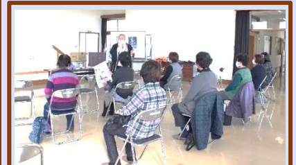
大盛況だった『まごころ説法』