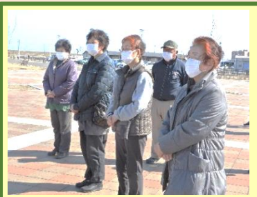
犠牲者への黙禱 (3月11日 14時46分)