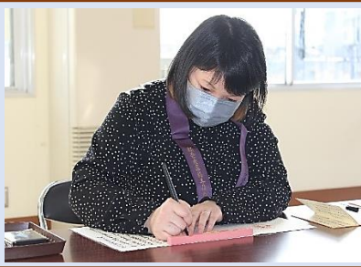
写経に専念する参加者