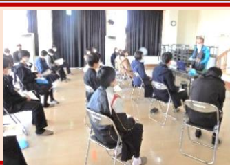
千曲市立屋代中学校