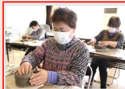
どう?! プロの手つきでしょ!