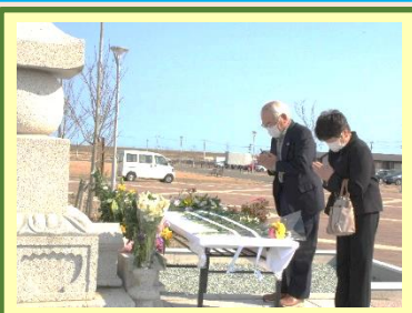
犠牲者への献花 (3月11日)