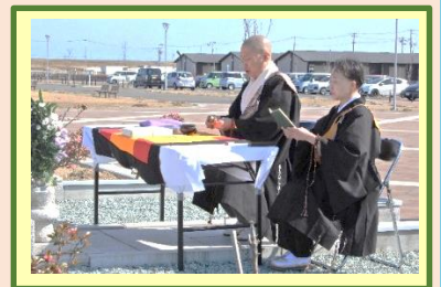
306名の大震災犠牲者の 御霊に、祈りと読経