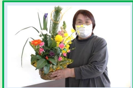
ほ～ら綺麗でしょ。私の方が