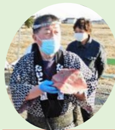
被災地にガッツを