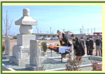
黙禱を捧げる来場者