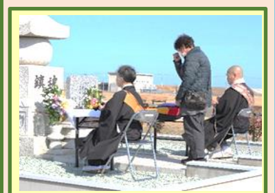
来場者によるご焼香