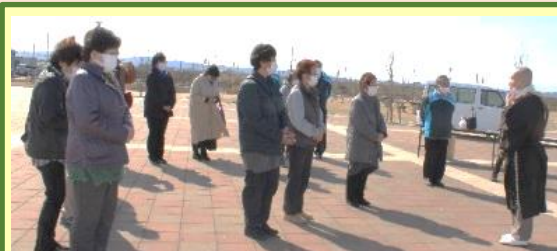
法話に耳を傾け、震災への思いを 新たにすする来場者 (3月9日)