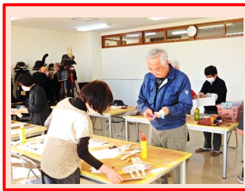
兜の製作は神経を使います