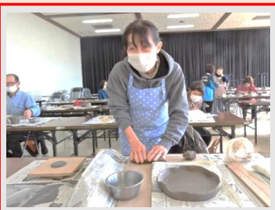
こうやって、こうやって作るの！