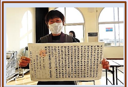
般若心経を書写しました!!