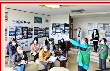
石巻市観光協会の皆様

東日本大震災から10年が経過し、全国各地から修学旅行生や地域の団体が、被災地の亘理町を見学に訪れています。震災語り部ワツタリの10名のメンバーが、震災時の映像や画像を使って荒浜地区の被災の現状と復興の様子を伝えています。中高生と一緒に津波防災や減災を考えながら津波の教訓として共有しています。