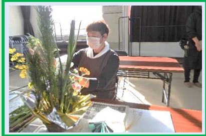
バランスはこんな感じかな

お正月の装飾用としてF.アレンジメントに挑戦しました。亙理駅前の花屋さんのご指導で大変素敵な作品に仕上がりました。お褒めの言葉は『私の話をよく聞いたこと。』でした。出来栄えは別・・・？ ですか。