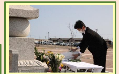
306名の御霊に献花 (国交省政務官が来町)