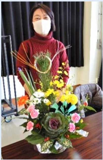
こりゃあ 傑作だわね