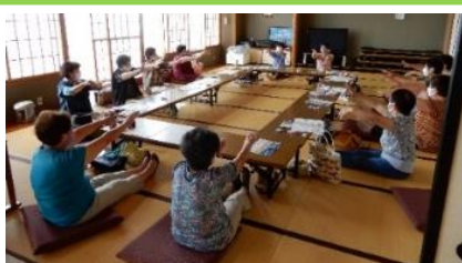
体操で心身ともに健康

地域の団体活動として定着してきた荒浜ボランティア婦人の会の皆様が亶理町の出前講座「体操教室」を実施しました。コロナ禍でも安全対策は万全でした。