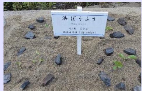
絶滅危惧種「浜ぼうふう」も移植されていました。