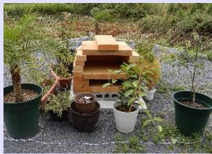
なんとピザ窯まで!! みんなで行ってみよう!!