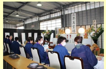
法要はお盆の伝統行事

8月15日(土)「2020年わたり夏の夕べ」が荒浜漁港の荷捌き場(魚市場)で開催されました。今年は新型コロナウイルス感染症予防策により、例年の夏まつりが縮小され、「法要・灯籠流し・光のメッセージ」のみの実施となりました。