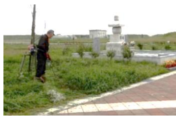
刈り払い機も調子よし

鎮魂の杜慰霊碑周辺から西側の嵩上げ花壇までの除草作業を三日間に分けて実施しました。午前中の涼しい時間帯に作業を行いましたが、作業中の俄雨で中断があったりして捗らず、広い敷地の除草作業は大変です。作業をして頂いた皆様本当にお疲れ様でした。真夏の草は日々成長が早いので定期的な除草作業が必要になります。ご参加頂いた皆様には心から感謝申し上げます。