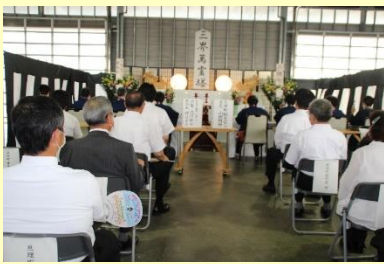
法要も三密を避けて