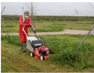
芝刈り機は絶好調