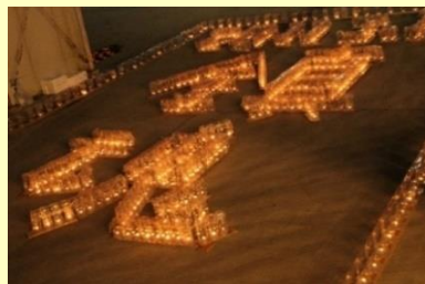
鎮魂の願いを文字に

光のメッセージでは1700個のペットボトルランタンを使い鎮魂の願いを灯しました。また、鳥の海灣では子供達が描いたメッセージやイラストの切子灯籠が水面を静かに移動していく様子を多くの人たちが静かに見守っていました。