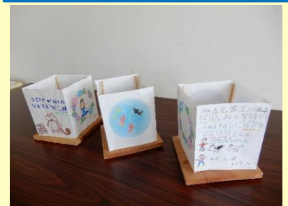
子供たちが描いた切子絵