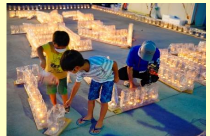
点火を手伝う子供達