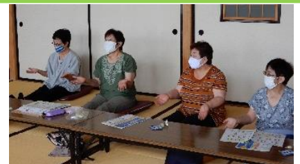
畳の上で行う体操です

地域の団体活動として定着してきた荒浜ボランティア婦人の会の皆様が亶理町の出前講座「体操教室」を実施しました。コロナ禍でも安全対策は万全でした。