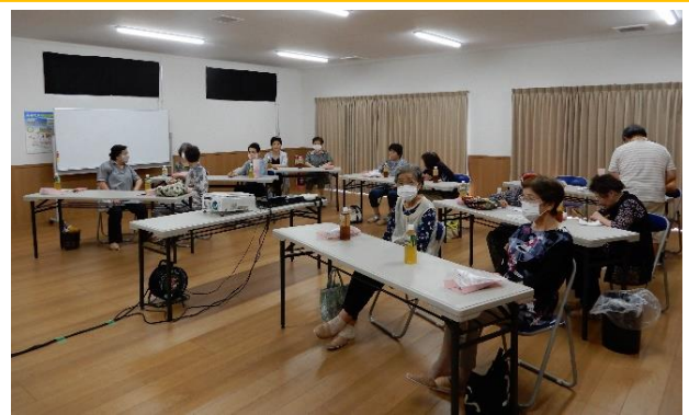
地域の老人会「福寿会」の皆様

箱根田東集会所にお集まり頂いた福寿会の皆さん。楽しく寅さんシリーズで映画鑑賞を楽しみました。コロナ渦の中で、仲間同士が集まって楽しい時間を一緒に過ごせることが、何よりですね。皆さんの明るい笑い声がお互いの元気の源になっている様です。また会いましょう。