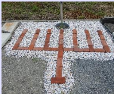
庭先の水場は燭台のデザインですよ。