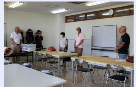
希望を胸に開講式

今年度で4年目になる『ものづくり講座』“甲冑製作プロジェクト”が9月13日(日)に開講しました。開講式当日から製作活動が始まり、受講生は講師の説明を真剣な眼差しで聞いて、意欲的に作業を進めていました。一連の講習は、18回続きで9か月の長丁場になります。作業は型紙から「ボンテックス」という特殊な素材の厚紙にトレースして加工します。小さな部品を数十個も造ります。さらに、防水塗料を施して真田ひもで組み立てます。受講生の皆さんは完成する日が楽しみな様子でした。