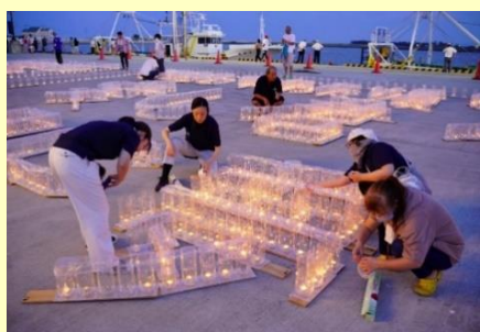
ランタンで作るメッセージ