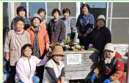
花植え終了。環境守り隊の皆さん

新年あけましておめでとうございます。 昨年は新型コロナウイルス感染拡大防止の観点から、まちづくり協議会主催の多くの事業が中止に追い込まれ、地区の皆様との交流ができなくなり大変残念に思っております。しかしながら、このようなコロナ禍の中でも役員の皆様が感染防止対策を慎重に施したうえで、実施できた事業があり、心から感謝申し上げます。 今年にはコロナ禍が一日も早く収束し、例年通りの事業が実施できることを切に願い、また、皆様のご健康とご活躍を祈念申し上げ、新年のご挨拶といたします。