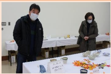
素敵な作品ですね。