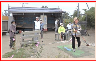
これは入るんでね……んだね