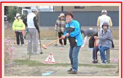
もしかして Hole in one?