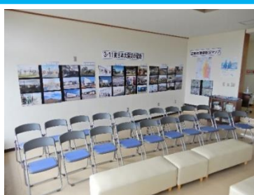
玄関脇ホールの様子

交流センターの待合室に「東日本大震災の記録」として写真展示コーナーが設置されました。壁面には震災直後や避難所の様子等も展示しています。また、書籍、貴重な写真集の展示や津波襲来から復興までを収録したDVDも視聴できます。操作に不安な場合は交流センター職員に気軽にお声がけください。