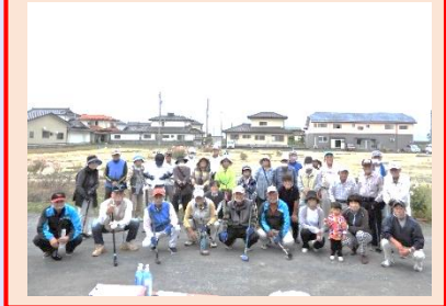
競技前に笑顔でハイチーズ