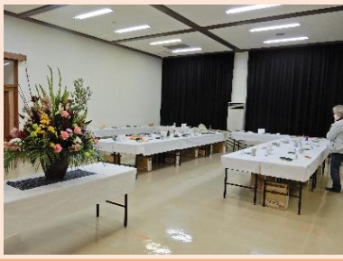
45名の作品展示会場

恒例の陶芸作品展示会を開催したところ、多くの入場者で賑わいました。展示された作品は、これまで「まんぷう窯」陶芸教室を受講された方々が出品したものです。展示品の中には初めて受講された方や30回も受講された方の作品が混在し、個性豊かで華やかな展示会になりました。