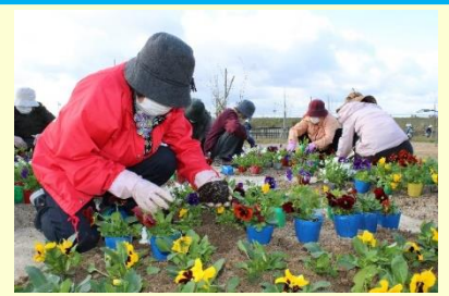
作業中のハマナス会の皆さん