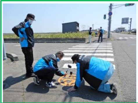
5月10日荒浜中学校交差点付近