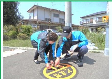
5月17日荒浜小学校東側横断歩道付近