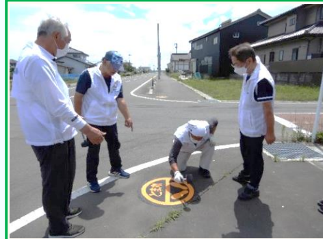
6月21日成就院様西側交差点付近