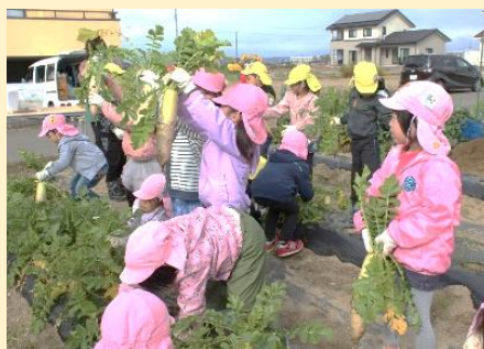
荒浜保育所 4・5 歳児 21 名がさつまいもと落花生と大根の収穫体験をしました 11月12日(金)