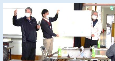
第3グループの内容発表