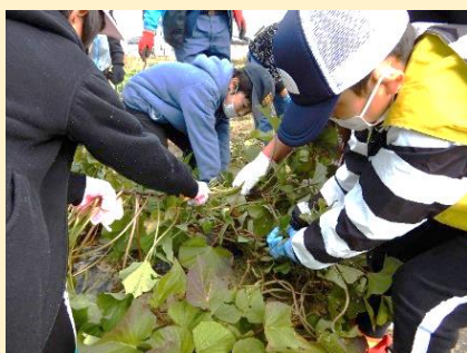
放課後楽校の児童 32 名がさつまいもの収穫体験 10月27日(水)