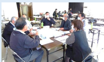
第1グループでの話し合い

荒浜に居住する皆さんで作る『まちづくり計画』。この地域のことをどのように進めていくかを考える会を行いました。3つのグループに分かれて、『地域の現状はこうだけれども、こういう風になればもっといいよね』、などといった主体的なアイデアがどんどん飛び出しました。最後のグループ発表の場では、3グループ全体で意見を共有し合うなど大いに盛り上がりました。策定委員会が出された意見を取りまとめ、今後5年間の『まちづくり事業計画』に盛り込まれることとなります。