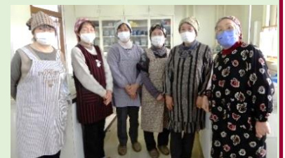
荒浜婦人会の皆さん 芋煮をご馳走さまでした

荒浜体育館で荒浜地区スポーツ交流会「卓球大会」が2年振りに開催されました。この大会を楽しみにしていたという声をたくさん頂き、朝早くから準備作業にあたる役員の手にも一層熱が入りました。会場には各地区から卓球愛好会や一般参加の36名が集合し、混合ダブルスのペアが受付の抽選で決まりました。受付時の混雑を避けるため男子枠を予め代理抽選で決定しましたが、来年は男子にも抽選権があれば楽しいねとの声がありました。大会は予選リーグ、決勝トーナメントのいずれも手に汗を握る緊迫したプレーの連続でしたが、試合後はお互いの健闘を称える清々しい光景が見られました。閉会式後は、交流センターで芋煮を食べながらの和やかな親睦会となりました。大会のたびに芋煮を調理して頂いている荒浜婦人会の皆さんに感謝します。『とてもおいしかったです。ご馳走さまでした。』