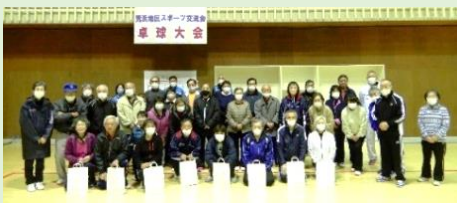
心地良い疲労と閉会式の写真