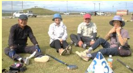
ラウンドの間に休憩と水分補給 何よりもおしゃべりが一番ですか

本年度はオープン直後の鳥の海公園多目的広場でグランドゴルフ大会を開催したところ、37名の腕自慢の方々が熱戦を繰り広げました。4~5名のグループに分かれ、8ホール・3ラウンド制で競技が始まりました。最初は天然芝の感触に馴染めず、力加減に戸惑う様子が見受けられましたが、終始笑顔の溢れるプレーが展開されました。それでもスコアを気にしての真剣勝負で火花を散らし、ラウンド途中の休憩では芝生でくつろぎながら世間話に花を咲かせ親睦を深めました。開始から2時間経過しても、普段から運動をされている皆さんの年齢を感じさせない軽快な動きと、全力でプレーする姿がとても印象的でした。閉会式ではブービー賞等の思いがけない賞や13名の方がホールインワン賞獲得で大きな歓声が湧きあがりました。終了後の片付けも部会員と共に最後まで手伝って頂きました。選手の皆様・役員の皆様大変お疲れ様でした。