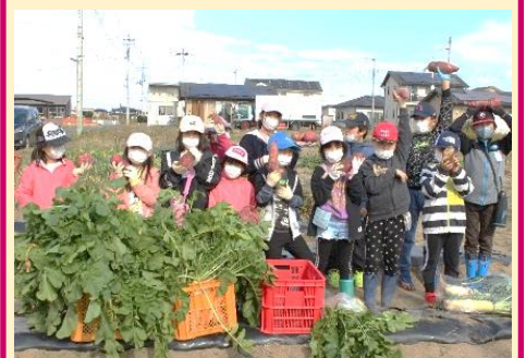
荒浜児童館の子供たちが大根の収穫体験 11月15日(月)

お世話役の役員の方々、活動ボランティアの皆様、保育所の先生方、児童館の先生方のご協力に感謝いたします。