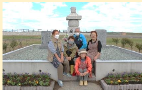
植え替えが終了し鳥の海防災公園の花壇前で寛ぐ『はまなす会』の皆さん