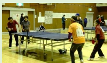
『ここは引けない』と真剣勝負