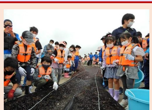
ワ～ここに魚が入ってる～。これ何？何？