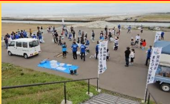
防潮堤の南端広場に集まった皆さん