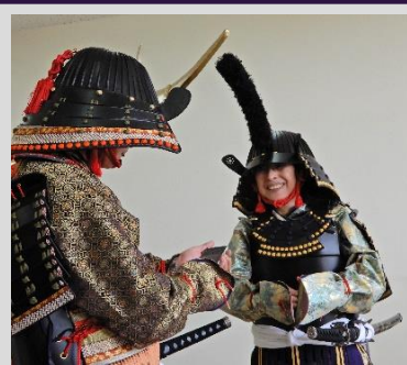
笑みがこぼれます

ボンテックスという1枚の特殊な厚紙が、受講生の手によって裁断・加工され、見事な甲冑に生まれ変わります。細かい工程を一つ一つ手作業で進めるのは神経を使いますが、完成にこぎつけて袖を通した時の成成感は本人しか味わえない特権です。装飾品として、展示品として、調度品として見ごたえのある素晴らしい作品が期待出来ます。講座の日以外にも時間を作り製作に励まれたということですがコロナ渦の不安な一年の中で完成させることができ本当に良かったと思います。コロナが落ち着いたら、イベントや各種の事業が復活すると思われれます。その折には自慢の手造り甲冑を纏って、是非荒浜を盛り上げていきたいと希望しておられます。(受講生談)