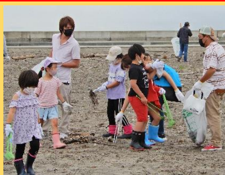
海岸清掃の開始です