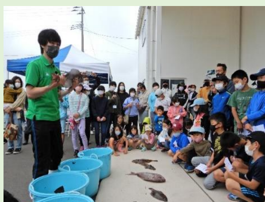
とれた魚の名前を真剣に聞いている子供達