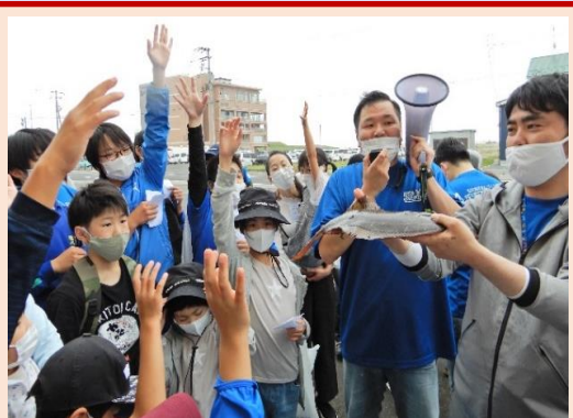
さあ。このヒラメ〇〇円。欲しい人は？ 安いよ！ 安いよ！ 今日特別だ！！