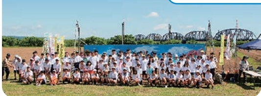
6月17日の種まき (花畑西側)

8月24日(日)には、ひまわりの花を楽しみながらいろいろなゲームや学びの各ブースに自由に参加ができる「ひまわりの花を楽しむ集い」を開催し、町内外から約260名の皆さまに楽しんでいただきました。