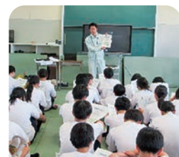
6月17日種まき終了後、国土交通省、JR東日本の職員の皆さんによる出前講座を開催(逢隈中学校)