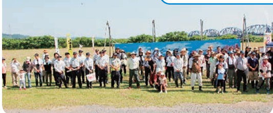
6月29日の種まき (花畑東側)