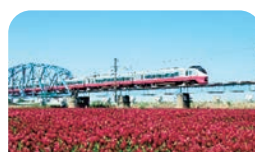
5月に咲いたクリムゾンクローバー