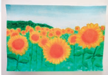
最優秀賞 長門 滯さん

逢隈中学校の 1 年生と逢隈小学校の 6 年生は毎年 6 月にひまわりの種まきに参加していただいております。6 月にひまわりの種をまいて、8 月には立派で綺麗なひまわりの花が咲きました。そのひまわりを描いていただき、11 月 22 日に開催いたしました文芸祭りに展示しコンテストを行いました。コンテストは一人 2 票で選んでいただき、投票数の多い順に最優秀賞と優秀賞を決めています。選ばれた作品と作者名は次のとおりでした。