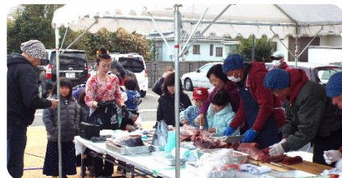
まぐろ解体ショー