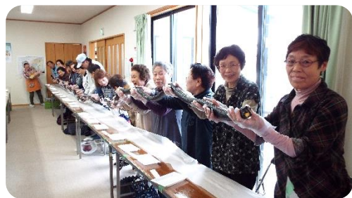
B I Gのり巻きチャレンジ