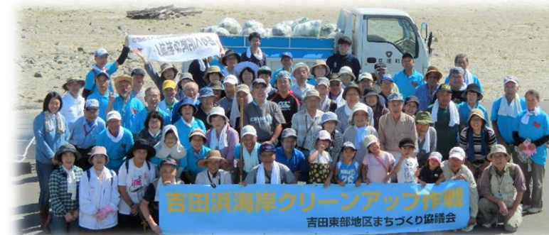
吉田浜海岸クリーンアップ作戦 吉田東部地区まちづくり協議会