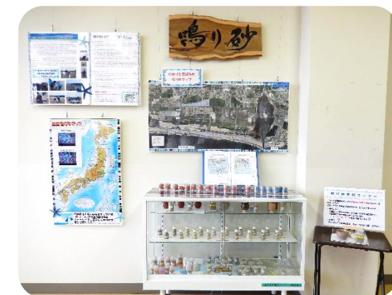
鳴り砂展示コーナー

また、大変めずらしい世界各地の鳴り砂も展示してあります。お気軽に遊びにお越しください♪