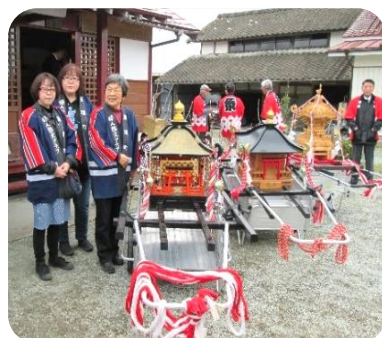
山神社3区のおみこし