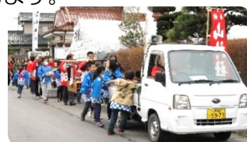
みこしパレードの様子

毎年4月第1土曜日の春祭りには、3台のおみこしが各地区を巡行します。午後には住民による演芸大会、くじ引き等が行われ桜の開花とともに楽しみな行事となっています。