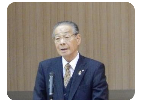
齋藤貞町長のご祝辞